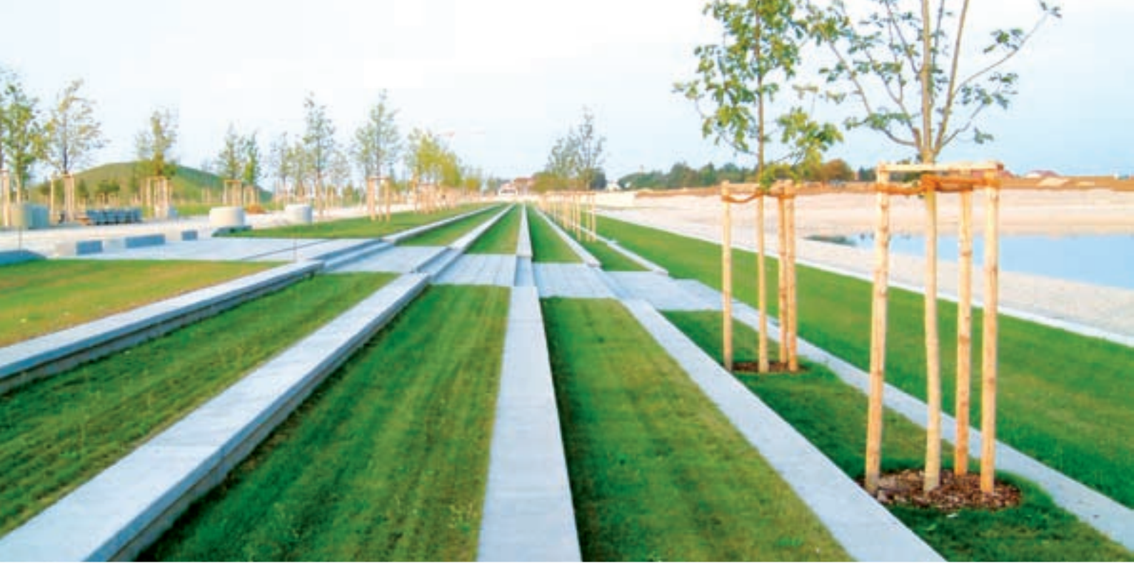
Bundesgartenschau 2005 – Nördliche Seekante